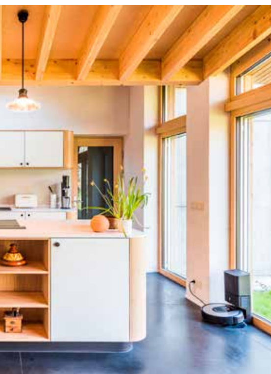
Meubelatelier Timmerwerkt maakt maatmeubels en -keukens met nieuwkomers.

Koester je plannen voor een eigen onderneming? Ga dan op tijd langs bij je verzekeringsmakelaar om jouw specifieke situatie te bekijken.